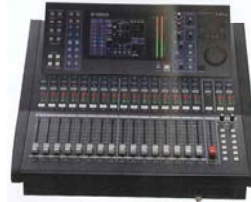
デジタルミキサー LS9